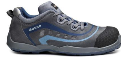
GOLF B0607 – wariant kolorystyczny